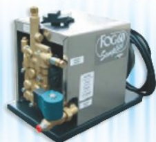
FOG 60 BASIC

BPS: no external drain valves required! BPS: elimina le valvole di scarico esterne!